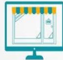
Adopción digital en pymes