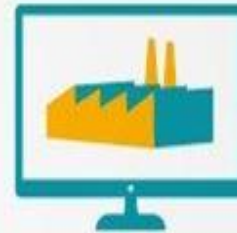
Transformación de sectores estratégicos